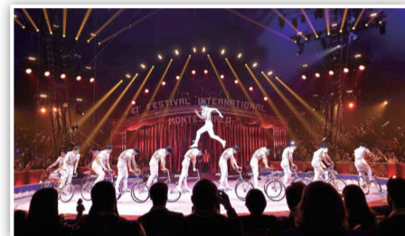
中国杂技团的演员表演《男子集体车技》。